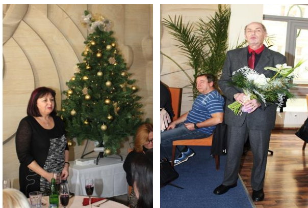
Pani ředitelka přivítala všechny přítomné