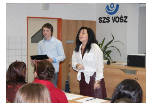
...která vzápětí předala slovo našim moderátorům