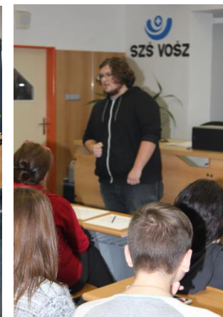
Recitátoři přednášeli své verše velmi pročitěně