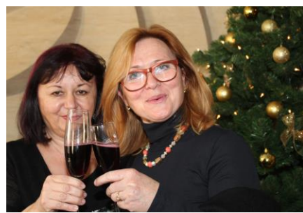
Slavnostní připítek si vychutnali všichni – i naše dvě pani ředitelky, současná a minulá