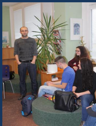
Text článku: PhDr. Ilona Gruberová

pády časté stále nerozmnožen rodu rozvětveného vzory žádné