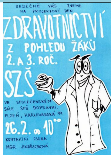
Plakáty vyrobené našimi žáky zvaly k návštěvě Projektového dne