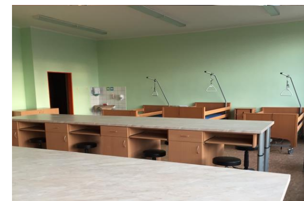
Učebna č. 303 – Edukační centrum seniory