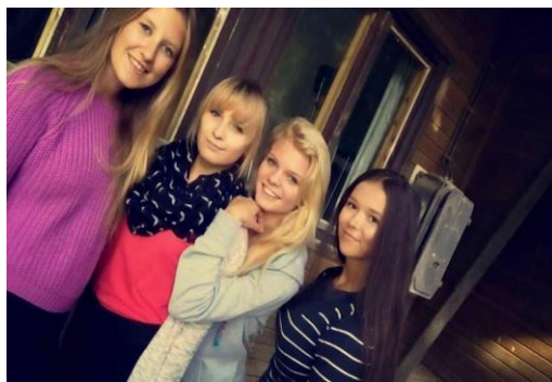
...a takto si kurzu užívali žáci z 1B ZA