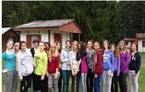
Děvčata z 1A ZA se na kurz velmi těšila...