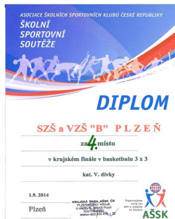
Obě družstva obdržela za svůj výkon diplom