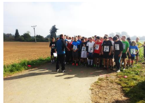
Na startu závodu...

Do soutěže se započítával čas čtyř nejlepších závodníků družstva. Obě naše družstva se umístila na 9. místě.