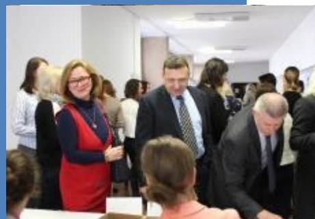
V předávání probíhala prezence zúčastněných. Bylo zde velmi živo již dlouho před zahájením symposia