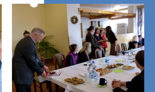
Přiblížilo se poledne – a tak paní ředitelka pozvala všechny hosty na raut