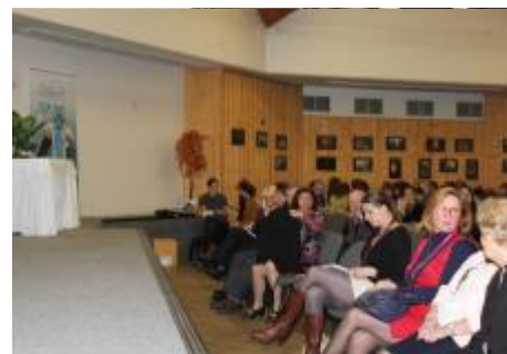
Sál se brzy zaplnil...