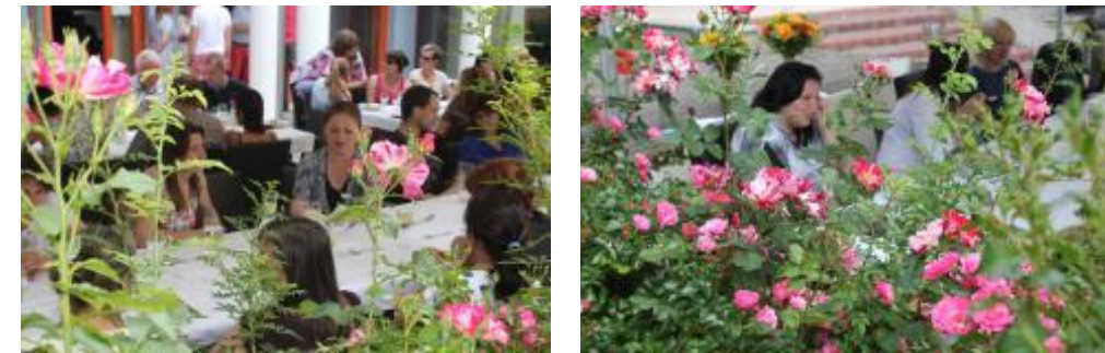
Krásné počasí, příjemná společnost, rozkvetlé růže – ideální prostředí pro předprázdninový oběd

Povídalo se, fotografovalo, jedlo, pilo a někteří „odvážlivci“ si zapálili i nezdravou cigaretu. Všichni tak už byli naladěni na prázdninovou atmosféru a loučení se školním rokem 2015/16 se oddalovalo až do pozdních odpoledních hodin.