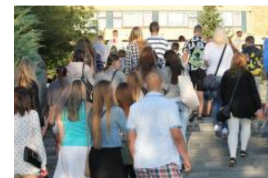
1. září bylo živo před školou i uvnitř