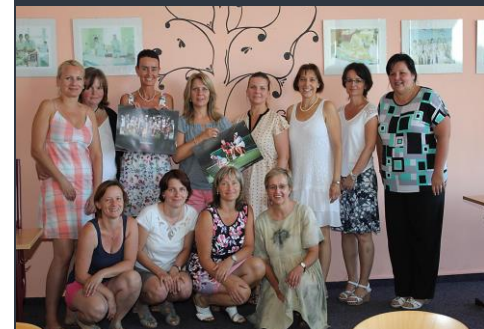
Naše kolegyně s kalendářem – to jsou také sestry v akci, co říkáte?