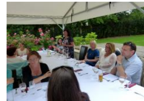
Krátký proslov paní ředitelky