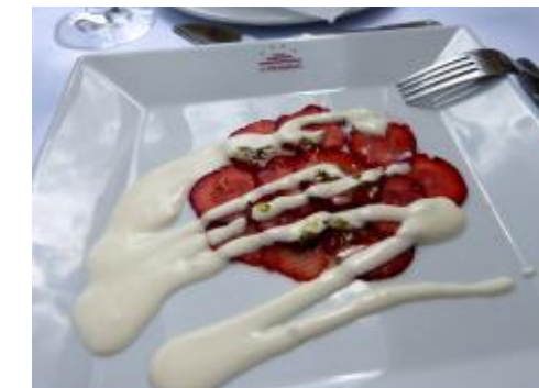
Dobručky, na které se srdce smálo... a poté se krásně rozplývaly na jazyku