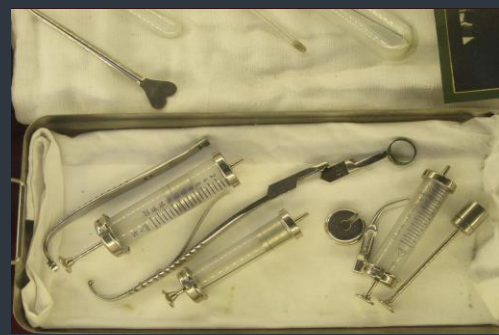
Naši žáci v sobě nezapřeli budoucí zdravotníky – z celého Legiovlaku je nejvíce zaujal zdravotnický vagon