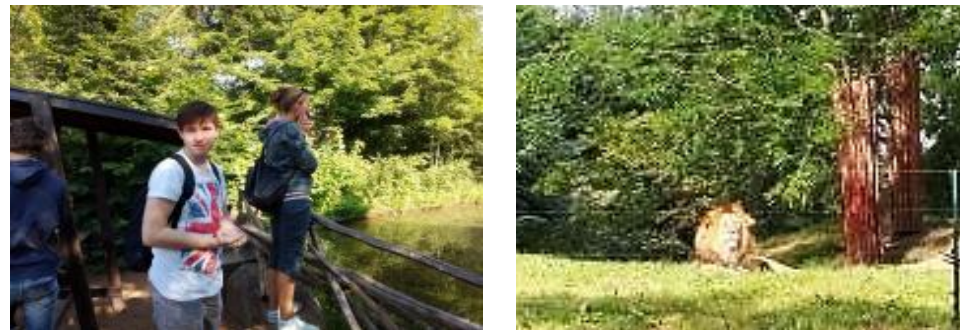
V horkém červnovém dni byla zoologická zahrada ideálním místem pro mimoškolní výuku