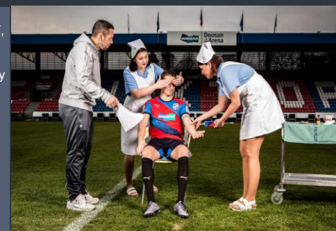
Jedna ze stran kalendáře – ten vážně nemá chybu!