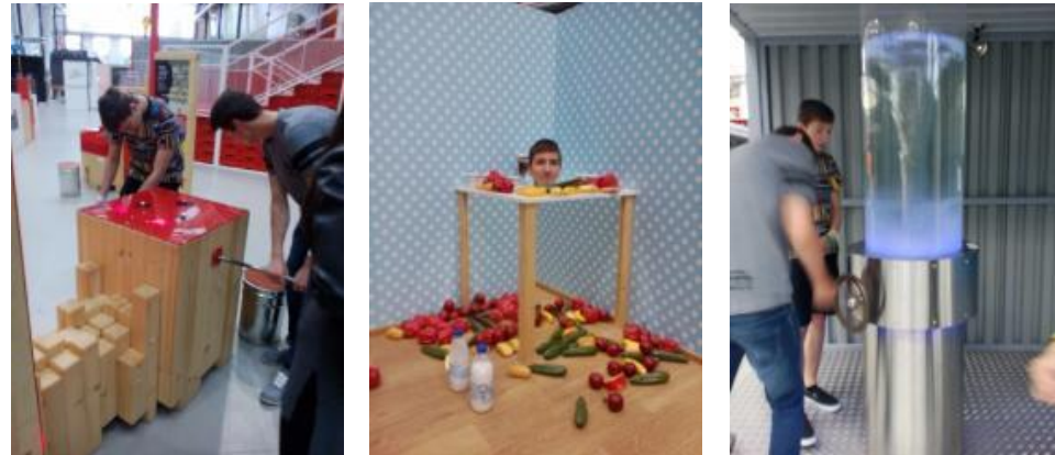
V Techmání jsme se nejen pobavili, ale získali jsme se i mnoho užitečných informací

Žáci třídy 1 LAA se v předprázdninových dnech zúčastnili dvou aktivit – komentované prohlídky ZOO a programu z nabídky Techmanie. O tom, že obě tyto akce byly přínosné a žáky velmi zaujaly, svědčí následující fotografie: