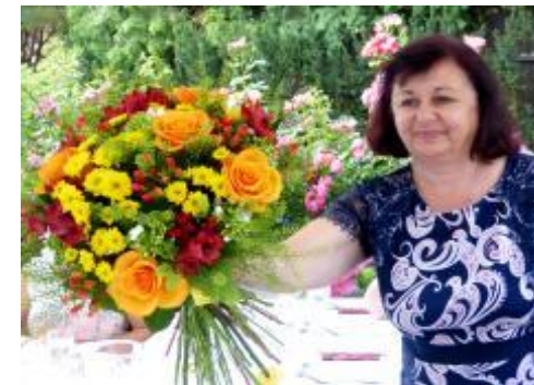
Kytice pro paní ředitelku