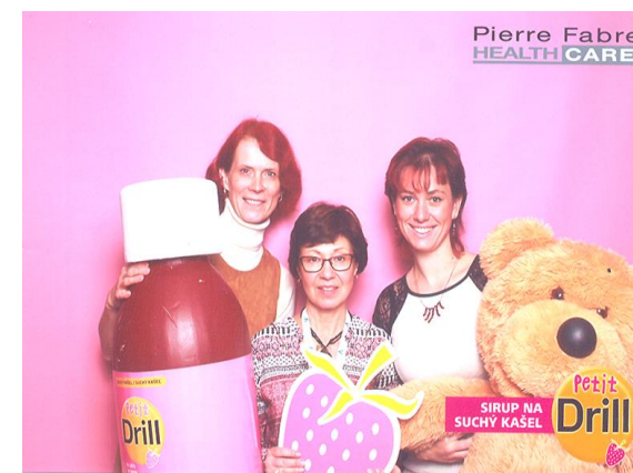
Podívejte se, jak to našim kolegyním na reklamním snímku firmy Pierre Fabre báječně sluší!