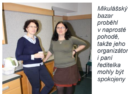
Mikulášský bazar proběhl v naprosté pohodě, takže jeho organizátorky i paní ředitelka mohly být spokojeny