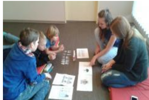
Studentky 2 DDH dětem hravou formou vysvětlily nutnost správné výživy i vhodné techniky čištění zubů