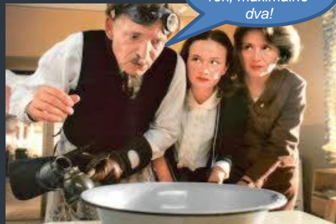
Tradiční vánoční věštění – líti olova