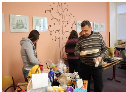
Výborné občerstvení, množství dárečků k zakoupení... každý z návštěvníků bazaru si přišel na své