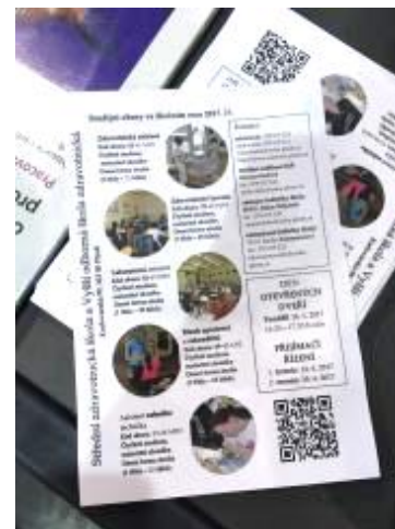
Jak samotný stánek, tak i letáky s nabídkou oborů naší školy zaujaly mnoho zájemců