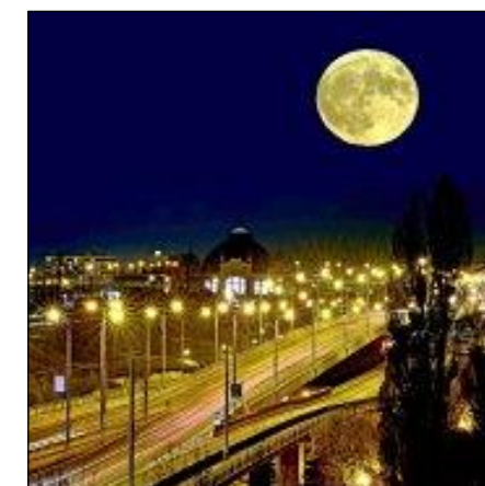
Takto vyfotil superúplněk nad Plzní pan Vladimír Křivka. To je „jiný kafe“, vidíte?