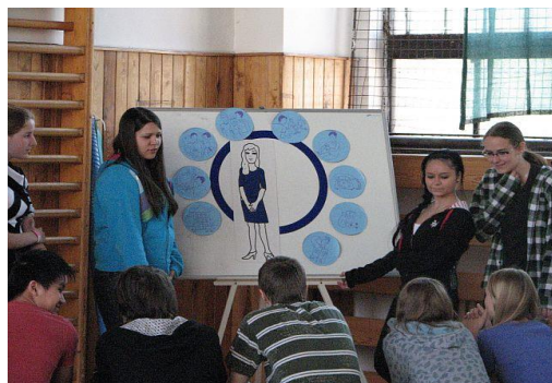
Akce Hrou proti AIDS se zúčastnili rovněž žáci 3A. ZŠ