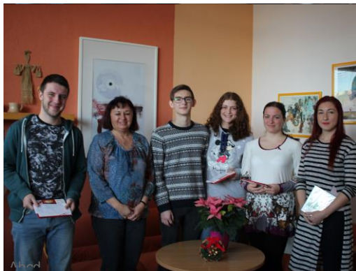
Vítěze soutěže „O nejkrásnější vánoční pohádku“ přijala paní ředitelka a jejich snahu ocenila sladkou odměnou