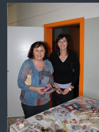
Význam bazaru podtrhla přítomnost paní ředitelky a paní zástupkyně na této akci