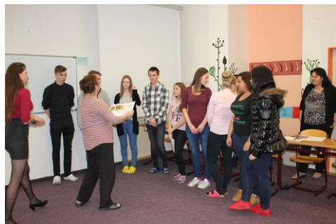
► ...a překvapení ve žlutých taškách pro vítěze