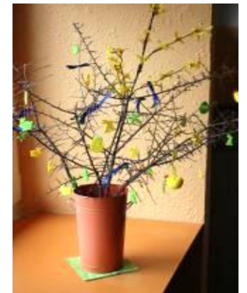
▲ Velikonoční výzdoba ve vestibulu školy