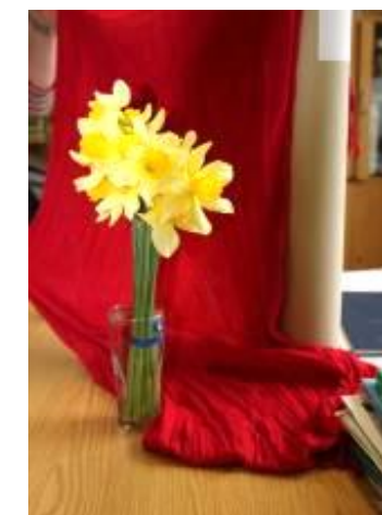
◀ U nás na zahradě je „přenarciskováno“, tak jsem přinesla kytičku i do kabinetu. S červenou šálkou kolegyně Ladky vytváří nádherné jarní zátiší