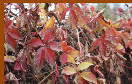
Psí víno se botanicky nazývá loubinec pětilistý, latinsky pak Parthenocissus quinquefolia. Jeho nádherné podzimní barvy září do dálky bez ohledu na jméno...