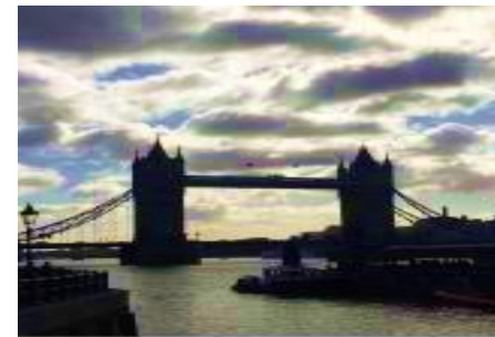
A opět Tower Bridge

Text článku: Mgr. Markéta Brichová