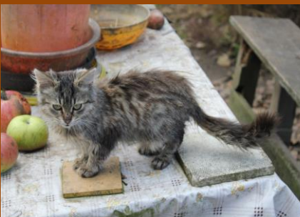
Podzimní zátiší s kotětem, květináči a jablky vzniklo úplně náhodou a velmi narychlo...