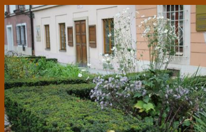
Mlýnská strouha, jedno z nejromantičtějších míst v Plzni, má své kouzlo i na podzim