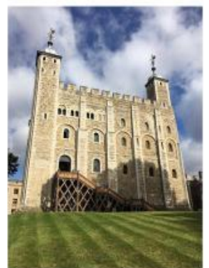
Tower of London