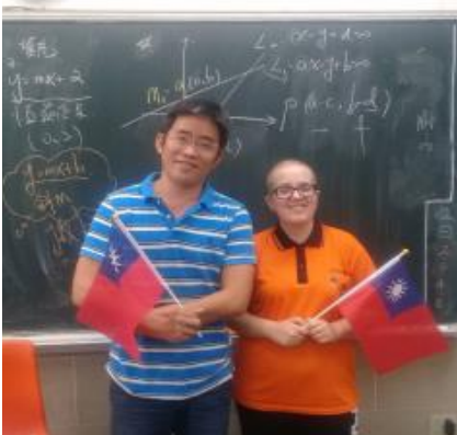
Ve škole s se svým učitelem matematiky