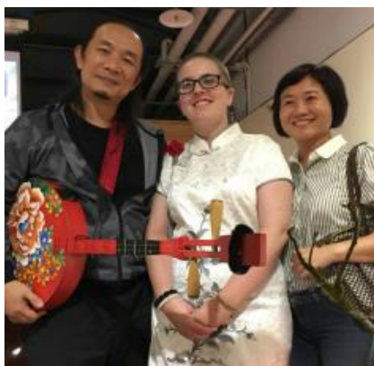
S „novými rodiči“