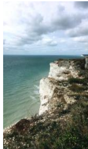
Útesy Beachy Head