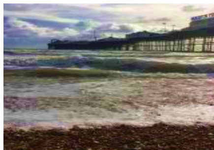
Molo The Brighton Marine Palace and Pier