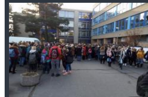
Po poplachu – prostranství před školou je plné...

Ten letošní se uskutečnil 13. 12. v dopoledních hodinách. Žáci, studenti i učitelé si ověřují evakuaci ze školy, kterou by museli použít v případě ohrožení. Tato mimořádná akce proběhla bez problémů a všichni organizátoři byli s jejím průběhem plně spokojeni.