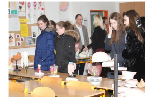
◀◀ Prezentace vedení školy ve zcela zaplněné učebně 219 se konala namísto třikrát dokonce čtyřikrát