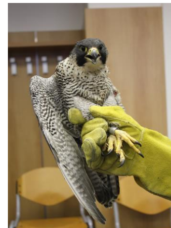
Jeden z nejnovějších přírůstků ZS – zatím bezejmenná samička sokola stěhovavého. Muselo jí být amputováno křídlo, které si popálila o dráty elektrického vedení. Byla okroužkována před 11 lety poblíž Máchova jezera