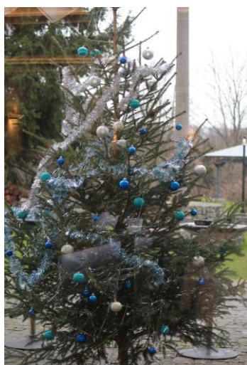
Ozdobený stromek na terase restaurace podtrhl slavnostní atmosféru setkání