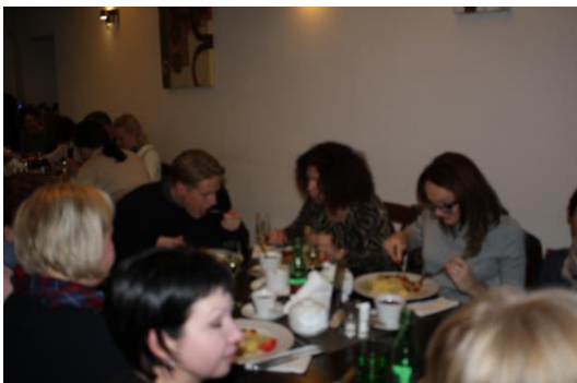
...a po něm už si všichni mohli pochutnávat na skvělém obědě

Foto a komentáře k fotografiím: Ing. Jaroslava Michálková