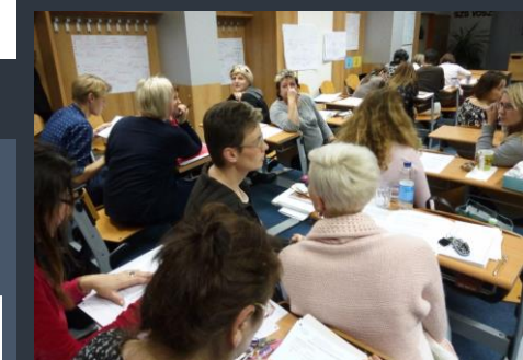
Pracovní atmosféra na školení

Dne 13. 12. 2017 byl pro některé naše kolegy zorganizován vzdělávací program na téma Trendy v ekonomickém a finančním vzdělávání v rámci projektu Efektivně k polyfunkční škole (neboli „Šablony“). Přestože školení probíhalo až do pozdních odpoledních hodin, všichni účastníci plně ocenili profesní kvality lektorky. Věříme, že získané informace využijeme jak v osobním životě, tak i při výuce.