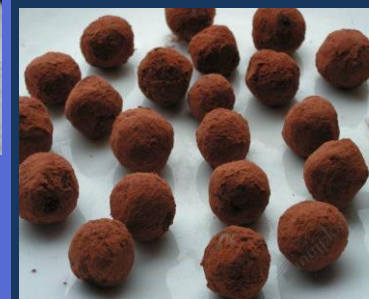
Výroba vánočního cukroví byla příjemným zpestřením celé akce

Celá akce se vydařila a doufáme, že si ji spolu s námi užili a odnesli si od nás nové poznatky a třeba i rozšířili své obzory v oblasti tvorby raw cukroví.