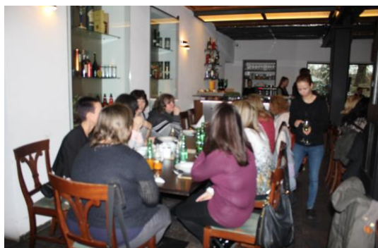
Takhle jsme se postupně scházeli v Kalikovském mlýně...