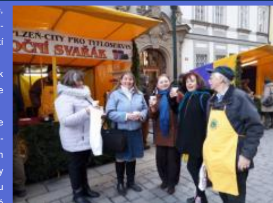
Takhle jsme se sešli u svařáku...