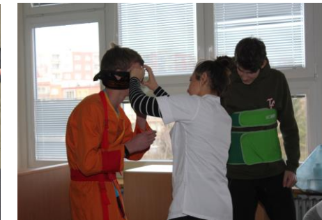
Do organizace Dne otevřených dveří se zapojili žáci všech oborů – na snímcích žáci 2 MSR při ukázkách masáže a děvčata ze 3 LAA v laboratoři