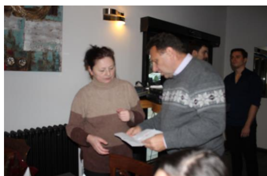
Některé i zde ještě řešili poslední pracovní záležitosti