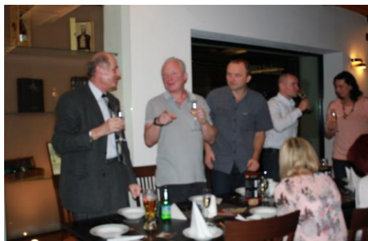
Následoval slavnostní příchůtek...