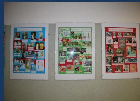
Kopie třípíchny Evy Tipanové zdobí školní chodbu. Originály všech prací zůstávají ve Fakultní nemocnici