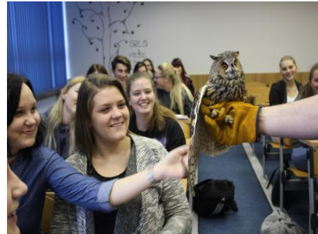
Samička kalouse ušatého Bedřiška přišla o křídlo, proto nemůže být vypuštěna zpět do přírody. Je to velice miloučká sovička, nechá se pohladit. Takže děvčata zjistila, jak velice heboučké peří mají sovy.