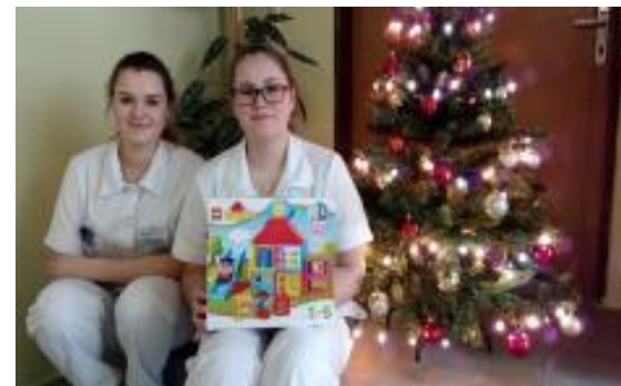
Divky ze 3A ZA předaly dárky malým pacientům na oddělení Dětské chirurgie