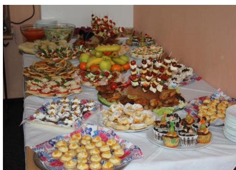
Tak takové dobroty připravily naše nutriční terapeutky