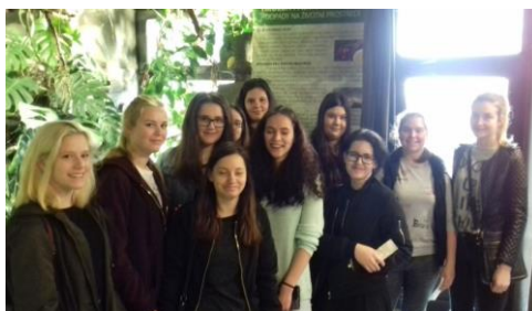
S třídou 2AZA navštívili expozici AKVA TERA na Palackého třídě 5 v Plzni, která umožnila žákům seznámit se s exotickou přírodou v centru města. Expozice jsou vytvářeny tak, aby vytvářely skutečný biotop-prales, poušť, sladké vody i korálové moře.

Žáci obdivovali bezobratlé živočichy, obojživelníky, ryby a plazy. Někteří odvážlivci se nebáli ani hadů.