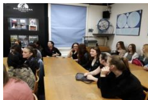
◀ Třída 2 ZDL se zúčastnila dvouhodinové zajímavé přednášky o vesmíru v plzeňské Hvězdárně.