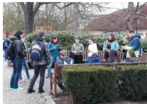
Třída 1 ZDL se zúčastnila výukového programu Na výpravě k Plzeňským řekám., který pořádá sdružení Ametyst, Aktivita začíná v Mlýnské Strouze a končí u Kalikovského mlýna..