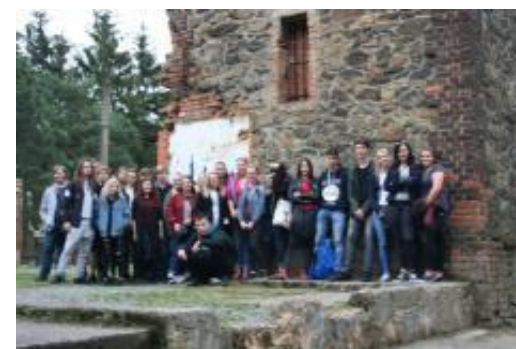
▼ Žáci třídy 3LAA byli na turistické vycházce. Trasa je zavedla na rozhlednu Chlum.