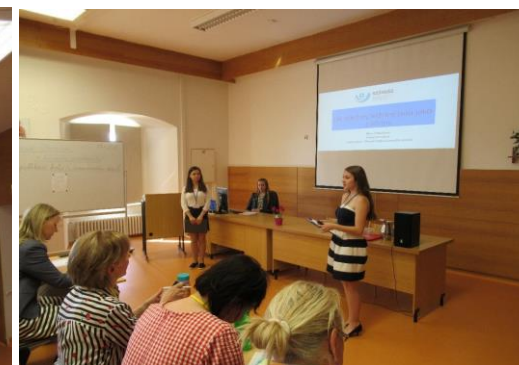
◀ Všichni účastníci Olympiády KLP na SZŠ Šumperk