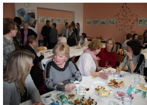
Při příjemném popovídání uteklo odpoledne jako voda