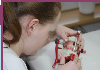
Praktická maturitní zkouška u oboru AZT