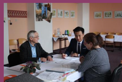
Ústní zkouška z českého jazyka a literatury