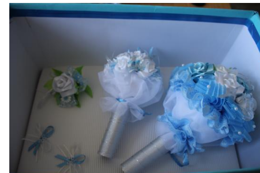
Bářiina „Svatba v modrém“: kytice pro nevěstu a družičku a girlanda pro ženicha, vpravo uložené v modré krabici