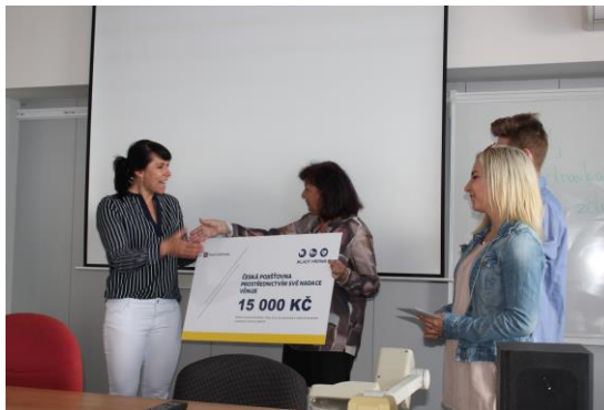
Naše škola dostala od České pojišťovny jednorázovou finanční podporu 15.000 Kč