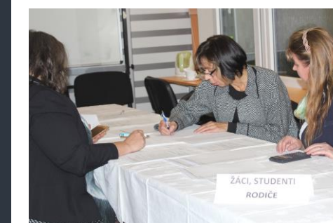
◀ A pak již nastalo sčítání hlasů...

Text článku: Ing. Jaroslava Michálková