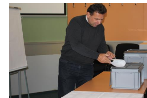
Účast pedagogů ve volbách byla jako obvykle vysoká – tentokrát 86,3 %