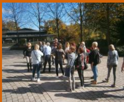
Text na základě vyprávění Libušky Mertlové napsala Ing. J. Michálková