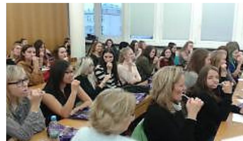
Studentky 1 DDH na konferenci mimo jiné nacvičovaly i správné čištění zubů