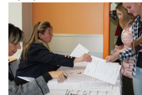
▲ Nejvíce zúčastněných studentů bylo z oboru DZZ, nejvíce žáků ze třídy 3A ZA – a tak volební komise měla stále plně ruce práce