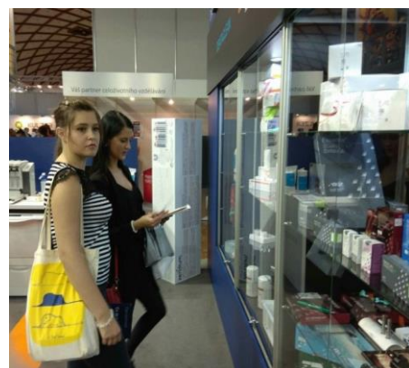
◀ Jednotlivé expozice naše studenty velmi zaujaly