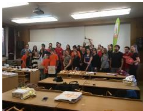
Účastníci soutěže SOS

„Soutěž byla pěkně zorganizovaná, moc se mi líbil přístup rozhodčích a celého týmu.“