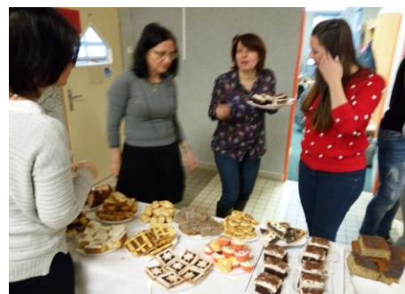
Výborné občerstvení přilákalo každého návštěvníka bazaru