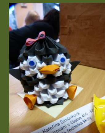
Vítěz soutěže – Tučňák Katky Šimůnkové

Oceněným žákům a studentům blahopřejeme a všem zúčastněným děkujeme. Překrásné výrobky budou po celý adventní čas zdobit vestibul školy.