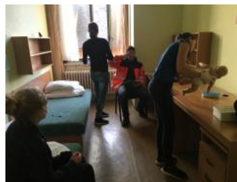
Resuscitace malého dítěte patřila k těm náročnějším úkolům

Tento rok naše žáky čekalo celkem 10 soutěžních stanovišť. Museli se například postarat o staršího muže – cyklistu, který spadl z kola, když okolo něj projížděl nákladní automobil. Dále poskytovali pomoc ženě, která měla těžkou alergickou reakci, pak ošetřili muže, který si při práci se sekerou způsobil ztrátové poranění ruky. Na dalších stanovištích pomáhali matce ukrajinské národnosti s resuscitací jejího dítěte, které vdechlo potravu, nebo si museli poradit s osobami posilněnými alkoholem a lysohlávkami.