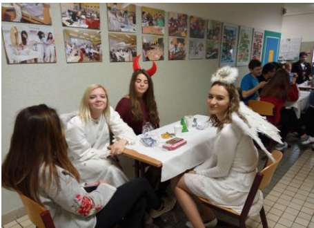
Spokojeni byli i andělé a čertíci, kteří dokreslili tu správnou mikulášskou atmosféru