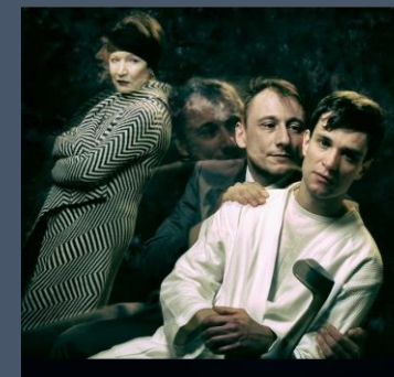
Text: Ing. J. Michálková

Jejich nadprůměrný výkon odměnili diváci dlouhotrvajícím potleskem – a my jsme se vraceli z Prahy obohaceni o krásný zážitek.