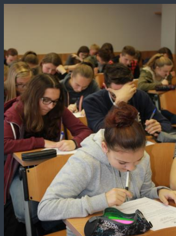
Některé úkoly daly žákům opravdu zabrat

Text Mgr. Ladislava Mutinská, Ing. Jaroslava Michálková