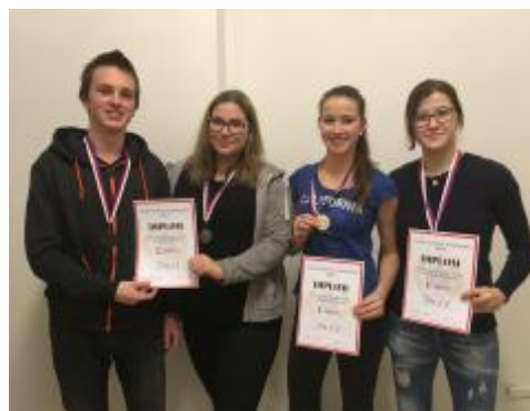
Náš stříbrný a zlatý tým

Veškerá poranění byla věrohodně namaslována. Na to jsou naši žáci již zvyklí, a to jak díky školním soutěžím první pomoci, tak i z celorepublikových kol této soutěže.