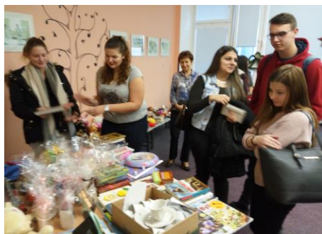
Na Mikulášském bazaru si opravdu každý přišel na své – nabídka dávků věnovaných k prodeji byla přebohatá