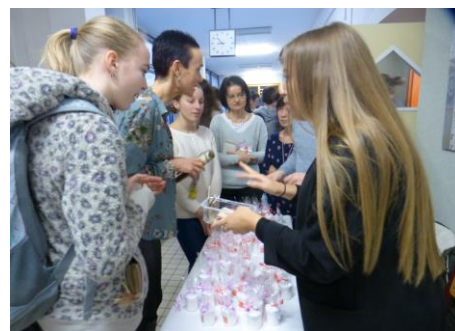
Farmaceutičtí asistenti vyrobili krémy, dentální hygienistky nabízely zubní pasty