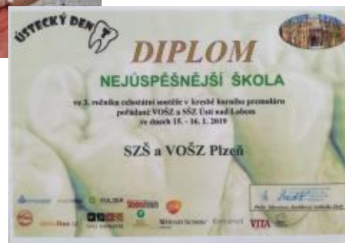
Diplom pro nejlépejší školu v kresbě