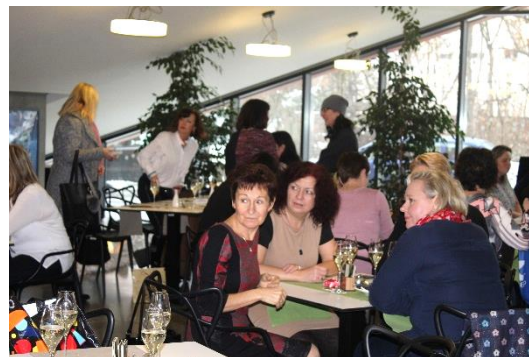
V restauraci Za oponou jsme se sešli téměř v plném počtu ve čtvrtek 21. prosince před 12. hodinou