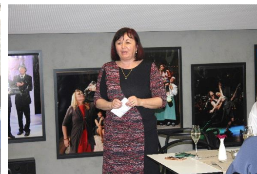
Po krátkém projevu s přáním příjemných svátků nás paní ředitelka seznámila rovněž se slavnostním menu