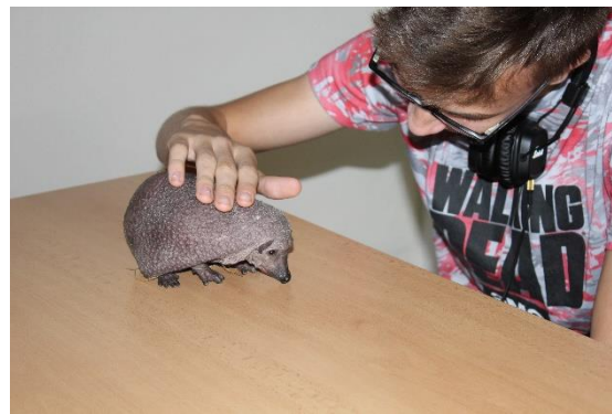
Nepíchá. Kvůli chybějícímu keratinu nemá dráčky, srst ani fousy. Matka ho kvůli jeho genetické vadě zavrhlá a odmítla se o podivného potomka - ježečka bez bodlín - postarat. V přírodě by neměl šanci přežít. Jedná se o samičku, která dosud neměla žádné jméno. Naši žáci pro ni navrhli jméno Alžběta, což se panu Jandíkovi líbilo – žádnou Alžbětu ještě v záchraně stanici nemají.