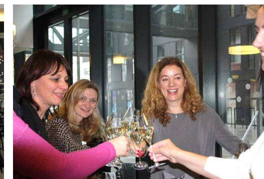
Nesměl chybět ani přípitek – tak na zdraví, na krásné Vánoce a šťastný nový rok – a hlavně aby ty vánoční prázdniny utíkaly co nejpomaleji.