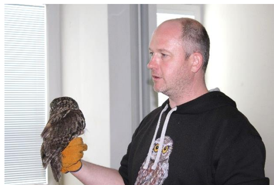
◀ Samička kalouse ušatého Bedříška nemá křídlo, proto není schopná přežít ve volné přírodě. Nechá se pohlédit, takže se naši žáci mohli přesvědčit, jak hebké peří mají sovy.