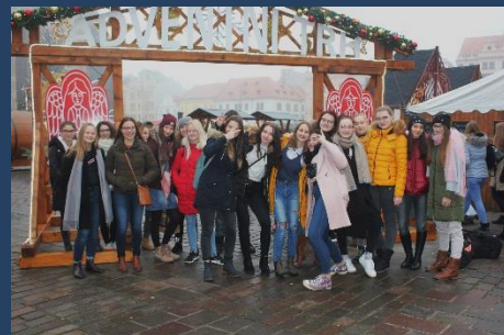
Před vstupem na Vánoční trhy

Myslím, že nikdo tohoto nápadu nelitoval. Všichni se dobře bavili, prohlédli si vyřezávaný betlém, zazvínili na vánoční zvon, některé zaujala nejvíce domácí zvířátka, jiné starobylý kolotoč. Celá třída si užila báječné předvánoční dopoledne.