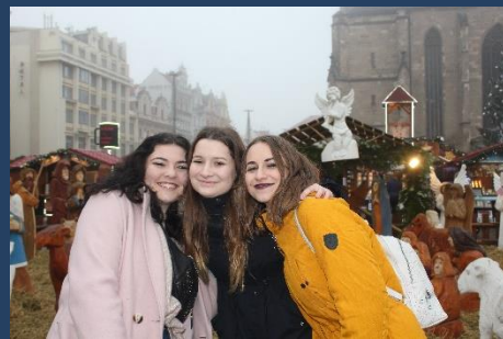
Půjdeme spolu do Betléma...