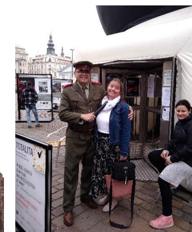
◀ Žáci 1 ZDL před projekčním domem ▲ Co provedla jejich třídní, že ji zatknul esenbák s pendrekem?