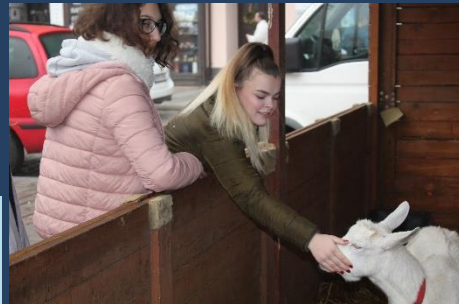
živá zvířátka – pro mnohé vzácnost