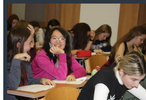
Účast na olympiádě byla jako každoročně hojná