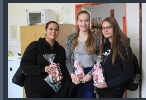
Ted' se už všechny usmívají – aby ne, když dostaly tak pěkné ceny!