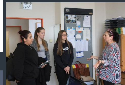
Vítězky – zpočátku byly trochu v rozpacích, neboť kolegyně Mutinská jim neřekla, proč mají přijít do kabinetu