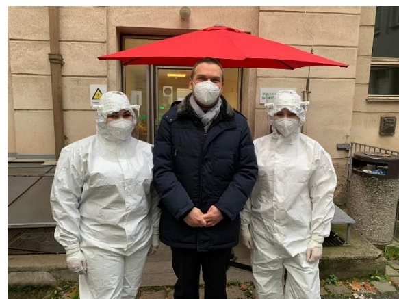
▲ V pracovním ochranném oděvu bychom děvčata skoro nepoznali...