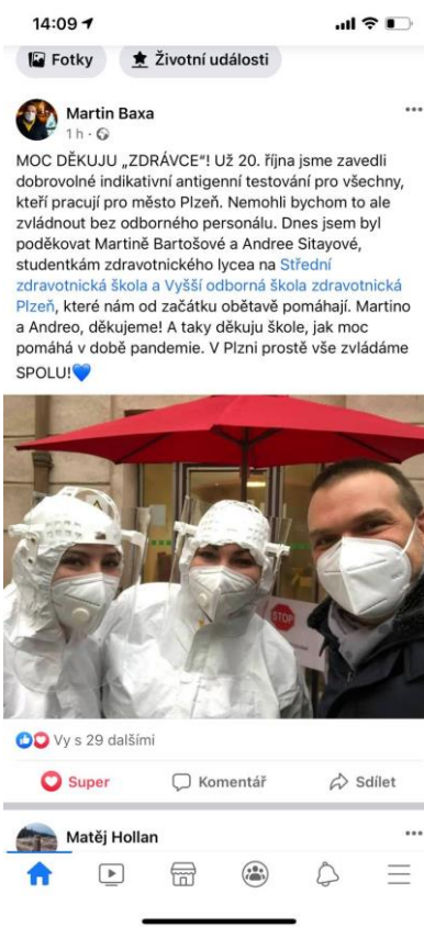
▲ Na svém facebookovém profilu pan primátor kladně hodnotil nejen práci našich studentek, ale i spolupráci se SZŠ a VOŠZ Píseň