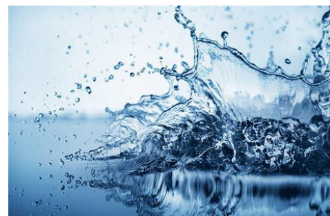
▲ Nádherný ostrov Zakynthos – bohužel jen virtuálně ▲► Tématem setkání byla VODA

Text článku a foto: Veronika Brejchová, 2B PS