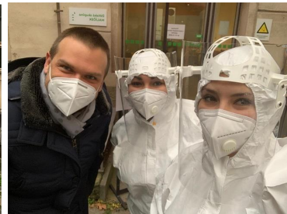
Připravila: Ing. Jaroslava Michálková.