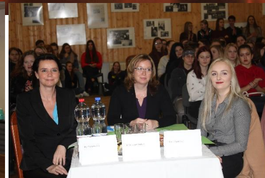
Porota zatím ještě netuší, že ji bude čekat nelehké rozhodování