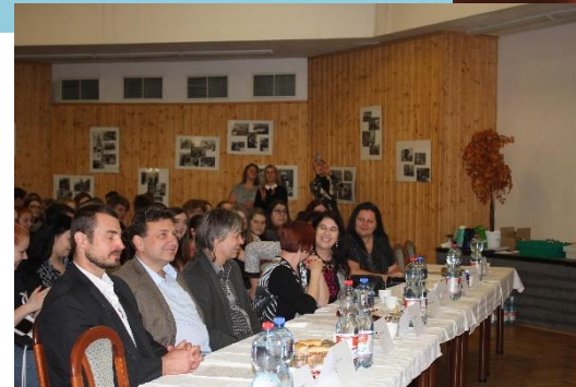
Hosté Projektového dne