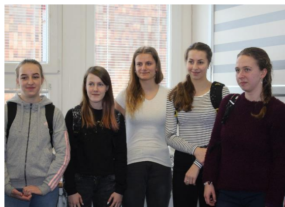
Děvčata, která se umístila na prvních třech místech