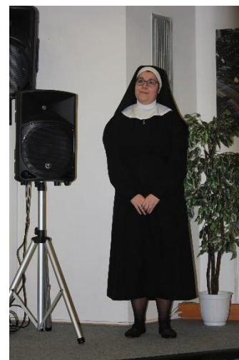
▲ Výborně připravená módní přehlídka zdravotnických oděvů různých dob nadchla všechny diváky