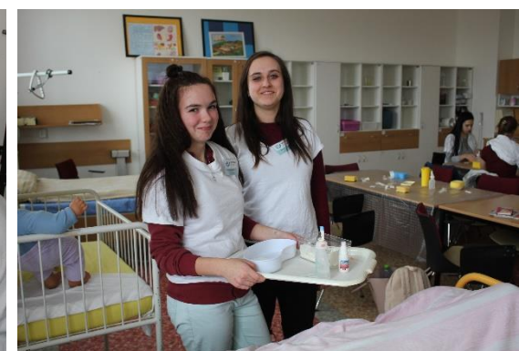
Takový obyčejný den na naší „zdrávce“ – výuka ošetrovatelství v odborné učebně