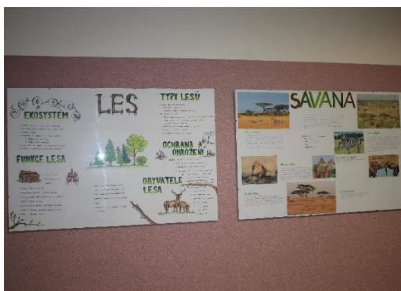
Vítězné plakáty a další zdařilé práce z této soutěže zdobí prostory chodby ve 3. podlaží