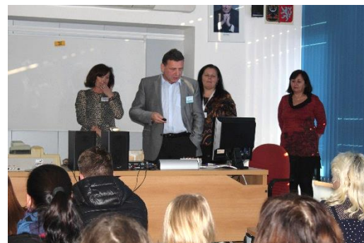
První z informačních bloků ve zcela zaplněné učebně 219