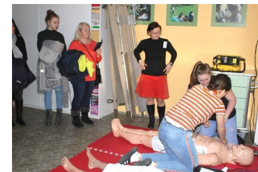
Kardiopulmonální resuscitace je skutečně dřina!