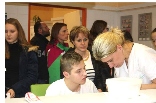
V příštím školním roce bude otevřen rovněž obor asistent zubního technika. Výuka v laboratoři probíhala přímo před zraky našich hostů