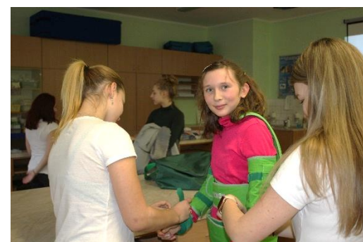
Svléci oblek simulující stáří je opravdová úleva!