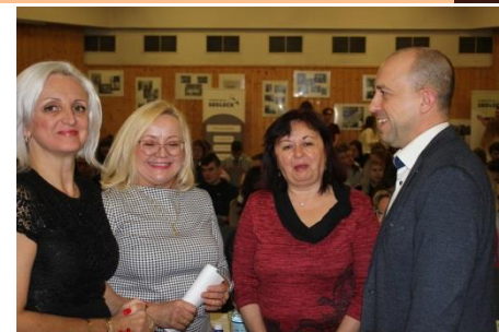
► Zcela zaplněný sál SPŠ dopravní

Fotogalerie z Projektového dne na str. 3.