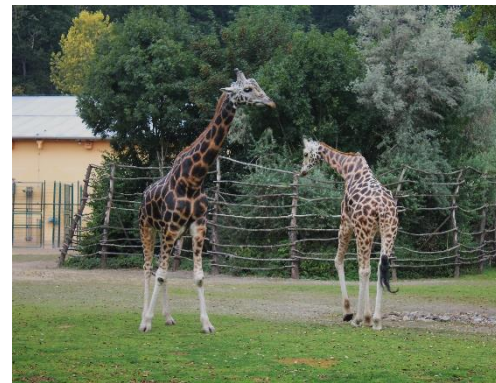
K nejobdivovanějším obyvatelům plzeňské ZOO patří žirafy Rothschildovy a lvi berberští. No, nepřipadáte si tu jako v Africe?