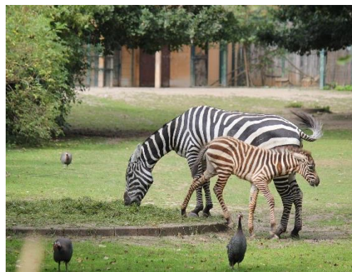
Naše kmotřenka zebra bezhřívá – maminka Tosia se svým hříbátkem – překvapilo nás, že malá zebříčka má hnědé (nikoli černé) pruhy