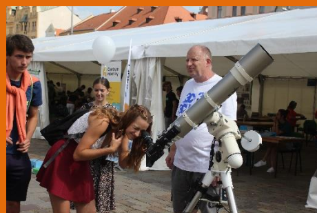
Sluníčko, sluníčko, popojdi maličko... ať tě pořádně vidím