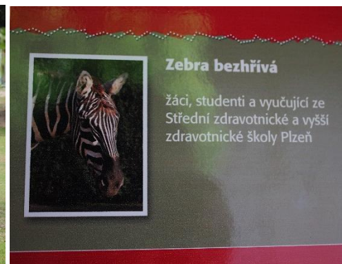
U vchodu do ZOO jsou umístěny tabulky se jmény kmotrů – našly jsme tam i tu „naši“