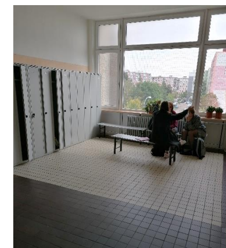
Nové šatní skříňky

Text: Ing. Jaroslava Michálková