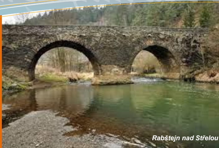
Rabštejn nad Střelou