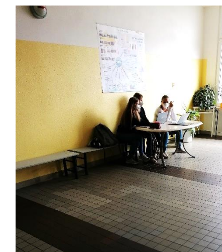
Žlutá malba na stěnách krásně rozzářila celé 0. podlaží

Přejeme všem našim čtenářům příjemný vstup do nového školního roku