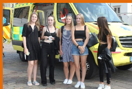
Děvčata ze 3 ZDL před vozem zdravotnické záchranné služby...

Pro naše budoucí zdravotníky bylo určitě nejpříťažlivější stanoviště fakulty zdravotnických studií. Zde bylo možné vyzkoušet si nejen resuscitaci na figurínách, což naši žáci znají z hodin první pomoci, ale podívat se do sanitky a popovídat si se záchranáři o jejich práci. To bylo pro naše žáky velmi zajímavé a přínosné.