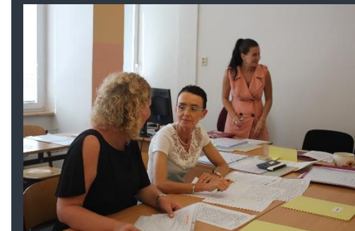
Zkoušející OSE jsou v pohodě...