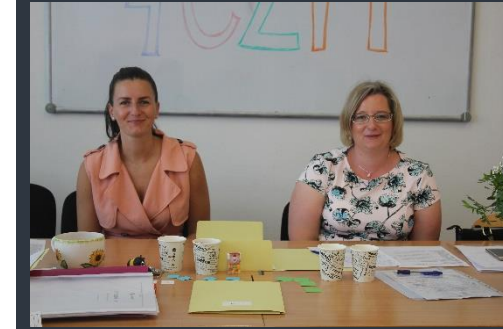
... rovněž i paní předsedkyně a paní třídní