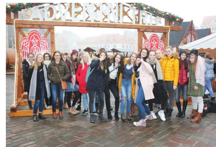
◀ Úžasná třída 1 ZDL na vánočních trzích.

Nejkrásnější na tom je to, jak jsme začali díky trhům více fungovat jako ta nejúžasnější třída. Trhy byly nezapomenutelné a jsem ráda za pořizené fotky, které nám vždy připomínají, jak moc jsme úžasná třída. Vážím si každého okamžiku stráveného s mými spolužáky, kterýkoliv den s nimi je výjimečný a nepopsatelný. Mám tu nejúžasnější třídu plnou úžasných lidí.