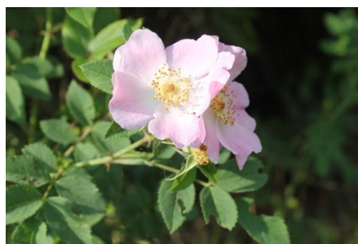
Růže šípková, tentokrát růžová