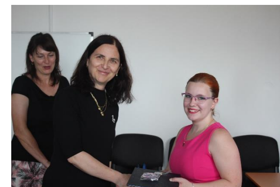
Předání absolventských diplomů letos neprobíhalo v Besedě... Takhle si slavnostní chvíli užili ve škole studenti SOP 3