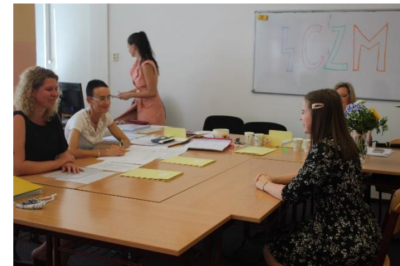
Maturitní zkoušky ve třídě 4C ZA