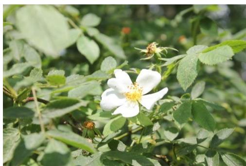
Růže šípková bílá

Červen je ten správný „růžový“ čas. Tak se podívejte, jaké růže u nás na zahradě teď kvetou: