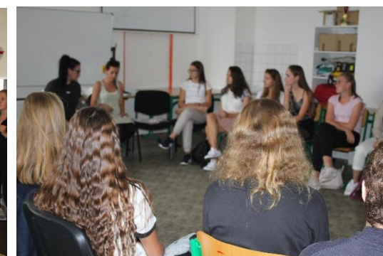
Třída 1 ZDL na přednášce Občanského sdružení Ulice

Velmi milým poprázdňinovým překvapením bylo pro všechny zprovoznění nové místnosti pro neformální setkávání, která vznikla v přízemí školy a bude mít zajisté bohaté využití.