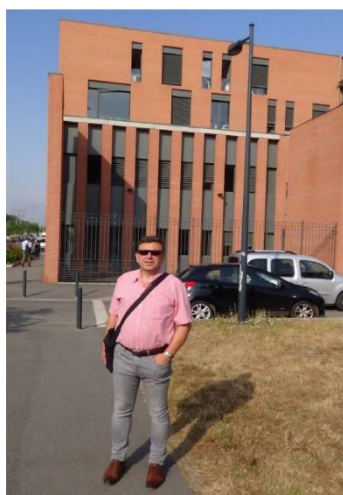
◀ Rektorát Akademie Toulouse

Text článku a foto. RNDr. Milan Štěpánek