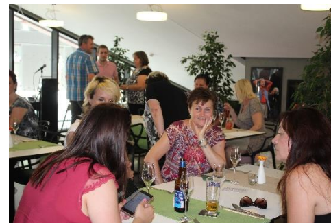
Restaurace Za Oponou dokáže vykouzlit příjemnou atmosféru