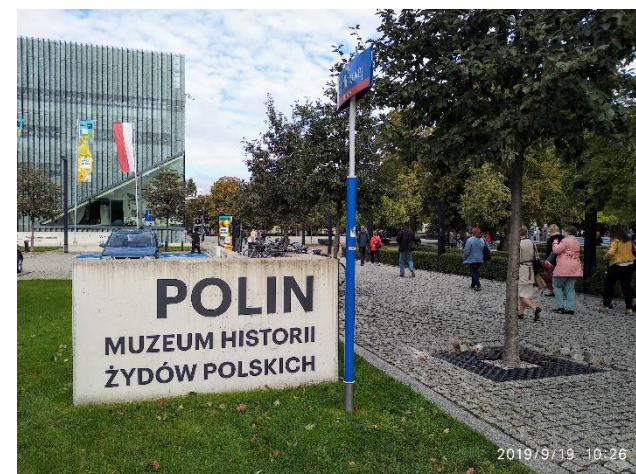
Muzeum dějin polských Židů

Další den v nás zanechal smíšené pocity, protože nás polská agentura počtila možností navštívit velkolepé muzeum dějin polských Židů. Smíšené pocity nás provázely proto, že na jedné straně jsme nepřestávali žasnout nad pojetím a sestavením tohoto ohromného interaktivního muzea, a na straně druhé skutečnost a znovupřipomenutí hrůzy a osudů této skupiny obyvatel. Muzeum bylo otevřeno v roce 2013 a nezaměřuje se pouze na druhou světovou válku a holocaust, ale popisuje i účast Židů na tvorbě polské kultury, vědy a ekonomiky. Líčí jejich historii od dob příchodu židovských kupců na území první polské republiky okolo roku 960 a počátků židovského osídlení, až po nejmodernější židovskou historii v třetí polské republice.