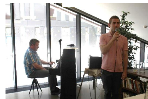
Slavné muzikálové melodie pohladily po duši...