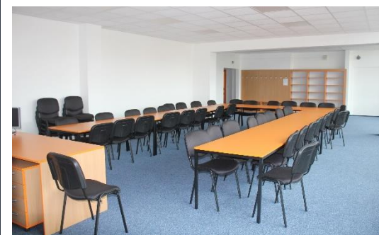
◀ Nová společenská místnost