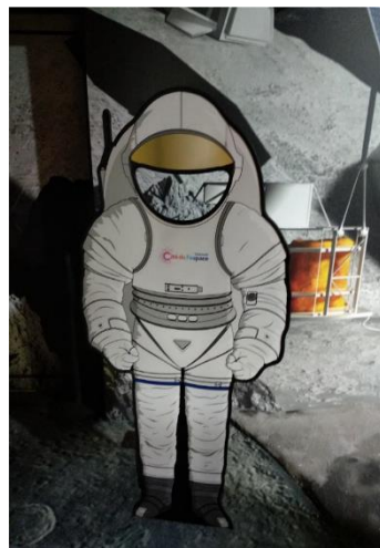
Cité de l'Espace v Toulouse