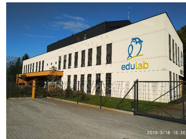
Soukromá škola EDULAB

https://padlet.com/ , johana.krajcirova@arpok.cz