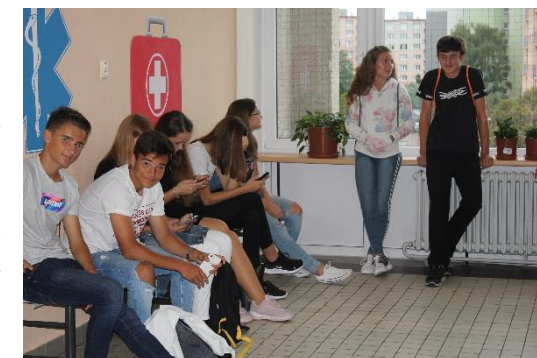
Tak už zase ve škole...

Další změnou byl „nový kabát“ adaptačního kurzu. Ten totiž probíhal ve škole. Kromě organizačních záležitostí a práce s třídními učiteli nechybělo ani množství seznamovacích aktivit a přednášky Občanského sdružení Ulice a prevence AIDS. Žáci hodnotili veškeré aktivity kladně – ale většina z nich by byla raději absolvovala adaptační kurz v přírodě, tak, jak bylo u nás ve škole zvykem v předcházejících letech.