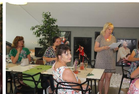
Tak co bude dnes dobrého?