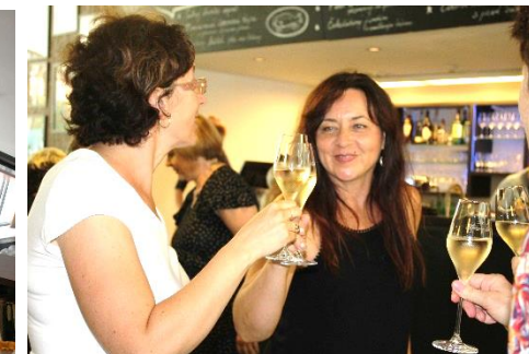
Na zdraví – a hezky dlouhé prázdniny!