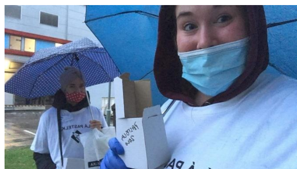
Dívky ze 4A ZA se nezalekly ani koronaviru, ani deště. Děkujeme!