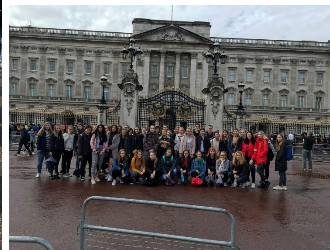
Před Buckinghamským palácem