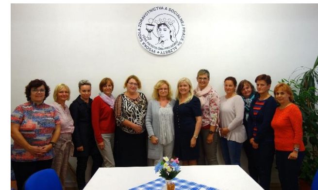
▲ Návštěva Vysoké školy zdravotnictva a sociálnej práce sv. Alžběty