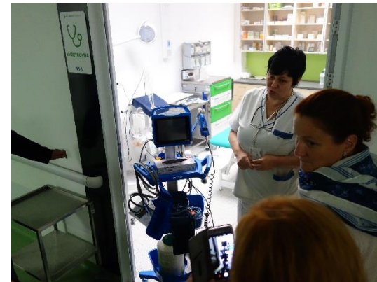
Identifikace zhoršení zdravotního stavu – napojení pacienta na monitor