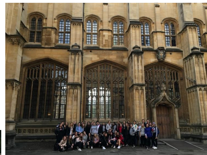
Slavná univerzita v Oxfordu