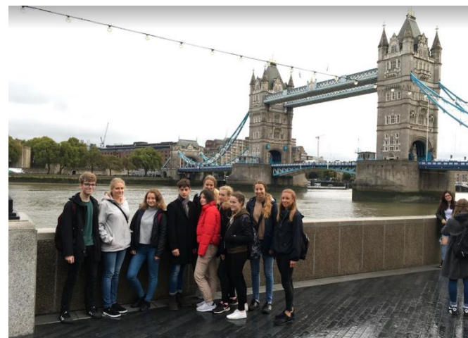
U Tower Bridge