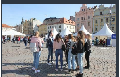
Žáci 1 ZDL si dopoledne užili...