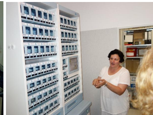
Centrální příprava léků