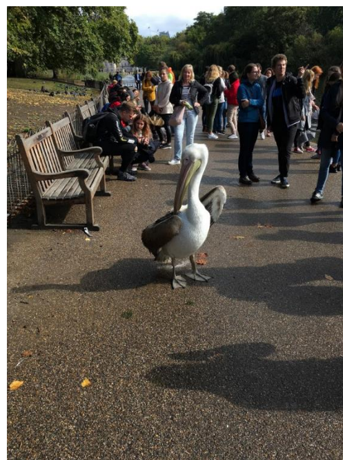
St. James Park